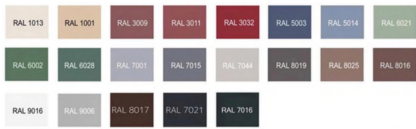
Цветовая палитра 8